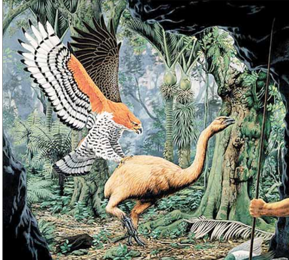
Основной добычей орла Хааста были нелетающие моа.